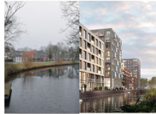
Damsterdiep bestaand (watergang met rijke historie) en verborgen bij de ontwikkeling van Stadshavens